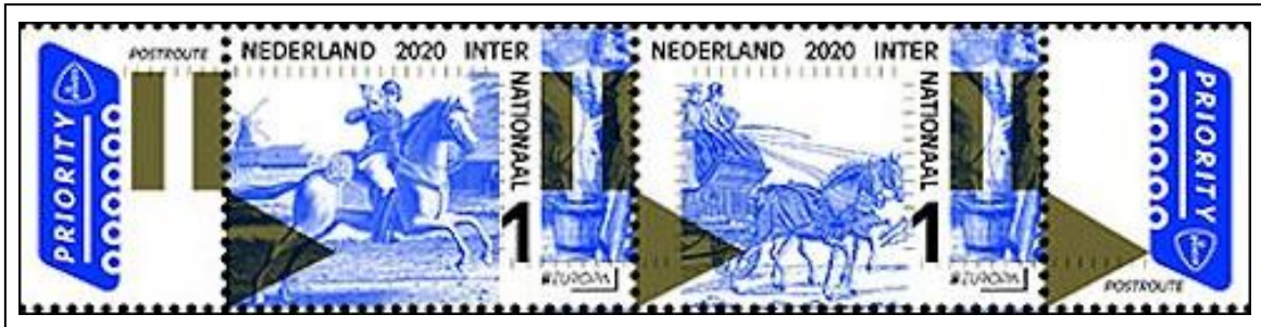
PostNL: Oude postroutes, Europazegels 2020

Van de zestiende eeuw tot de Franse Revolutie werd de postbezorging in Europa verzorgd door de familie Thurn und Taxis. PostNL schonk op 11 mei 2020 aandacht aan dit oude en eens zo machtige postbedrijf in het kader van de Europazegels. Het door PostNL uitgegeven vellekje met zes postzegels bevat twee verschillende ontwerpen: een postruiter en een postkoets.