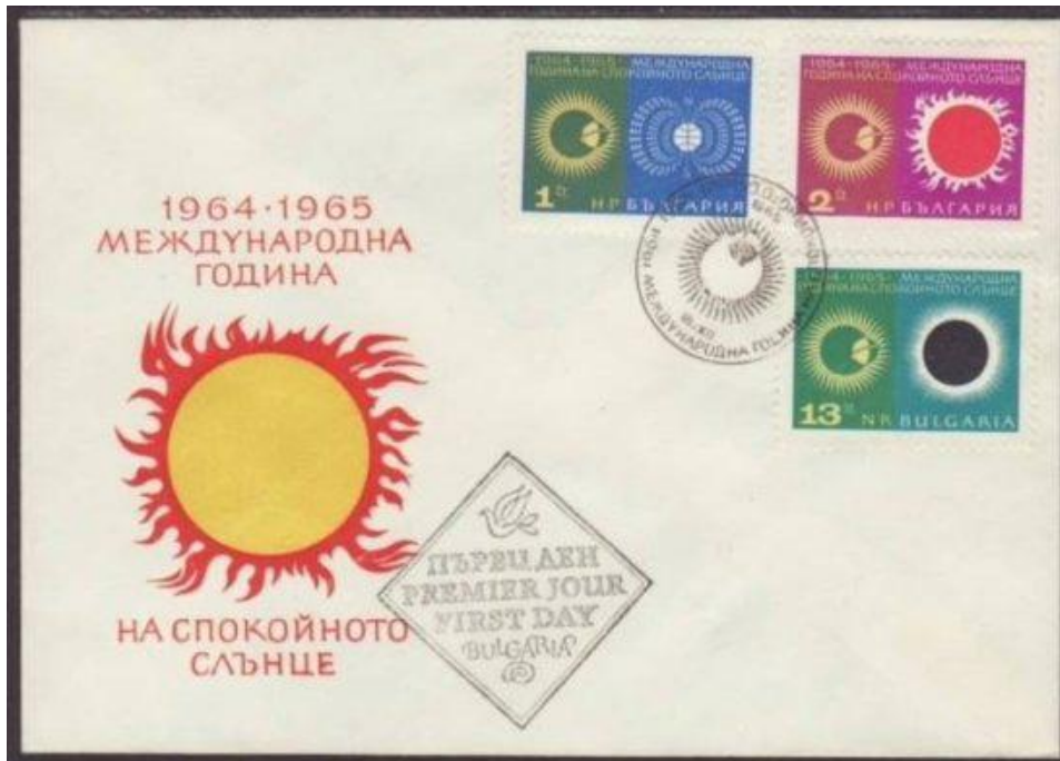
Bulgarije (1965): FDC International Quiet Sun Year (IQSY).

zich van dat verschil niets zou aantrekken en de duur van een jaar op 365 dagen zou afronden, dan zou men na vier jaar bijna een dag tekortkomen (preciezer: 23 uur en 15 minuten). Oud en nieuw zou dan te vroeg gevierd worden; bijna een dag voordat de aarde werkelijk helemaal rond de zon is gegaan. Het toelaten van de afwijking zou tot gevolg hebben dat de seizoenen ten opzichte van het kalenderjaar gaan verschuiven, het begin van de lente zou elke 100 jaar ongeveer 24 dagen vroeger vallen.