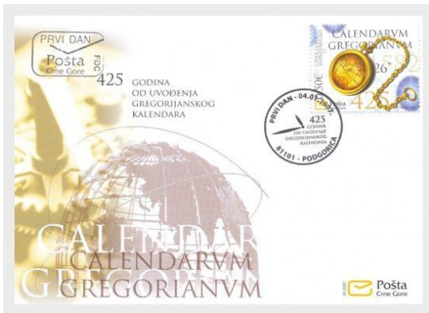
Montenegro (2007): FDC 425 jaar Gregoriaanse kalender.

Een schrikkeljaar is een kalenderjaar met 366 dagen in plaats van 365. Deze extra dag, een schrikkel dag, wordt ingevoerd omdat een kalenderjaar van 365 dagen ongeveer 6 uur korter duurt dan het tropisch jaar. Om te voorkomen dat de seizoenen, die vast aan het tropisch jaar verbonden zijn, te veel in een jaar verschuiven, wordt elke 4 jaar een correctie toegepast (met uitzondering van de eeuwjaren die geen veelvoud van 400 zijn).